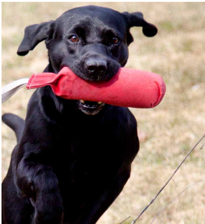
Labrador Retriever avlad på jaktlinjer (vuxen)