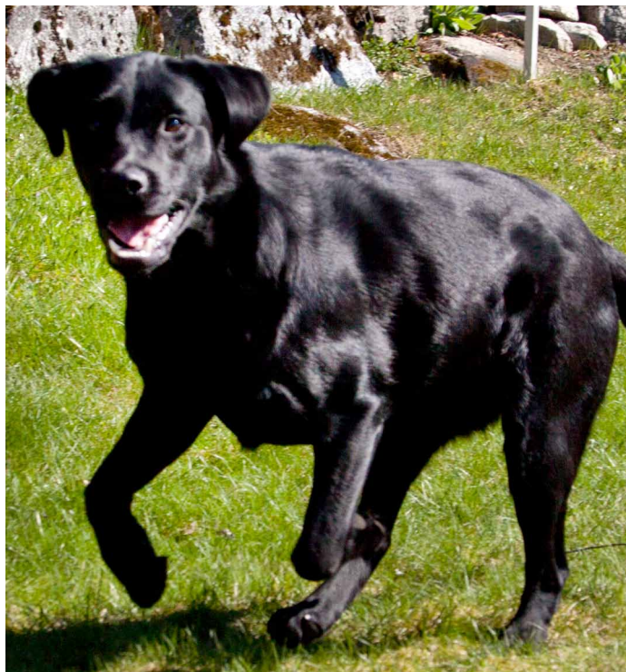
Labrador Retriever (13 månader gammal)

markeringsförmågan. En god markeringsförmåga bidrar starkt till hundens effektivitet som apportör. Söket utförs med stor uthållighet i ett högt tempo och i ett mönster som effektivt täcker anvisad terräng. Det utpräglade goda luktsinnet medverkar till en god förmåga att finna vilt. Bristande sökklust är ett allvarligt fel.