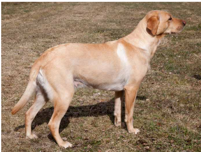
Labrador Retriever avlad på jaktlinjer (vuxen)

Rasens huvudsakliga uppgift i samband med jakt är att apportera fågel och småvilt.