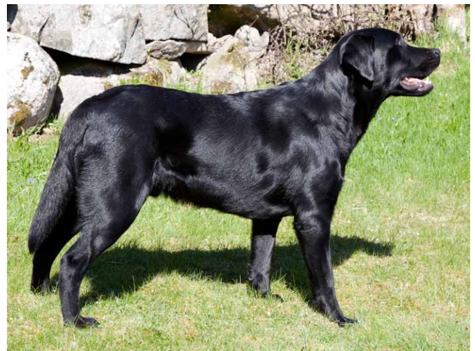
Labrador Retriever (13 månader gammal)