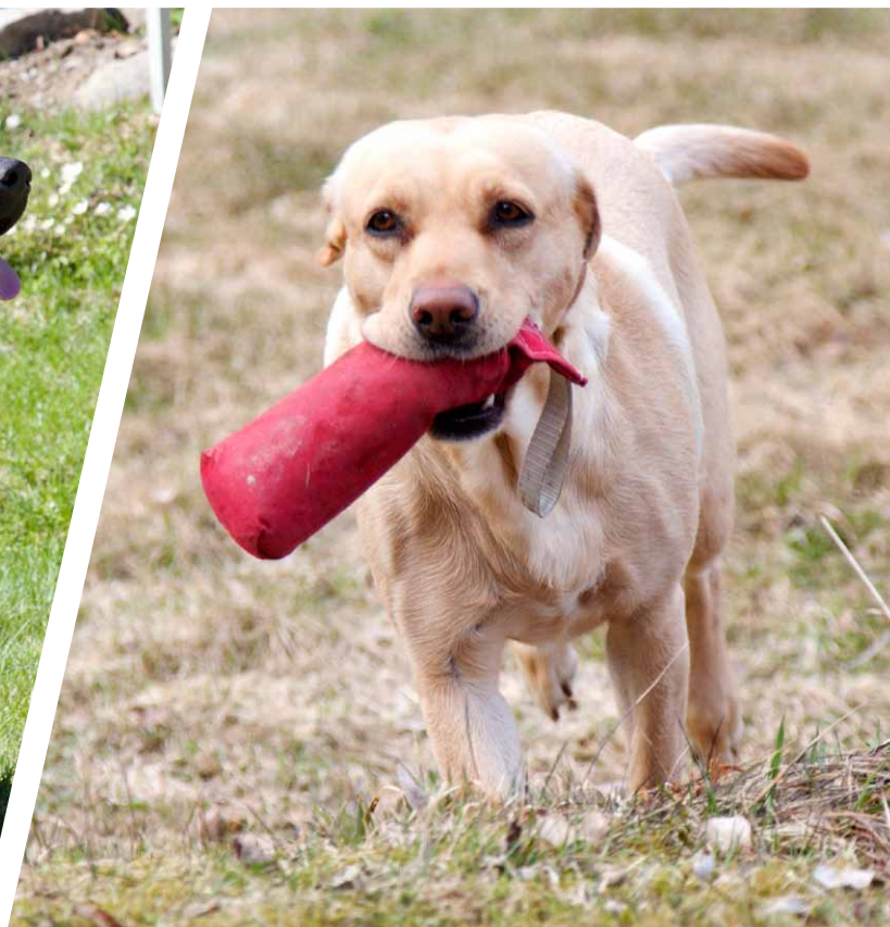
Labrador Retriever avlad på jaktlinjer (vuxen)

RASPRESENTATION Den stora skillnaden på dessa två typer är att en labrador retriever med jaktlinjer är avsevärt smalare och mer anpassad för jakt och hårt kroppsarbete i jämförelse med en rastypisk labrador retriever. Dock används båda typerna i samband med jakt, så därför kommer vi här försöka presentera båda. Det finns även en så kallad »Dual Purpose« som är en kombination av de båda typerna, där man försökt få »det bästa« av två världar, medan andra anser att man får varken eller.